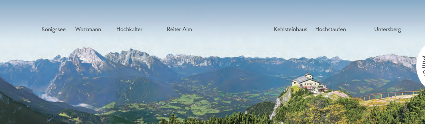
Panoramablick vom Kehlstein Panoramic view from the Kehlstein

Das Kehlsteinhaus liegt auf 1.834 Metern Höhe über Berchtesgaden. Seine Geschichte ist untrennbar mit der des Obersalzberg verbunden. Dort befand sich zwischen 1933 und 1945 das neben Berlin wichtigste Machtzentrum der nationalsozialistischen Diktatur, wo über Verfolgung, Krieg und Völkermord entschieden wurde.