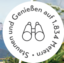
Das Gipfelkreuz ist vom Kehlsteinhaus aus in fünf Minuten erreichbar. The summit cross can be reached in five minutes from the Kehlsteinhaus.

Seit 1952 wird das Gebäude als Berggaststätte genutzt und wurde zu einem beliebten Ausflugsziel. Der Bau ist bis heute weitgehend original erhalten, während fast alle anderen Gebäude aus der NS-Zeit am Obersalzberg verschwunden sind. Eine Ausstellung informiert über die Geschichte des Kehlsteinhauses und seine Verbindung zu Hitler und dem Obersalzberg.