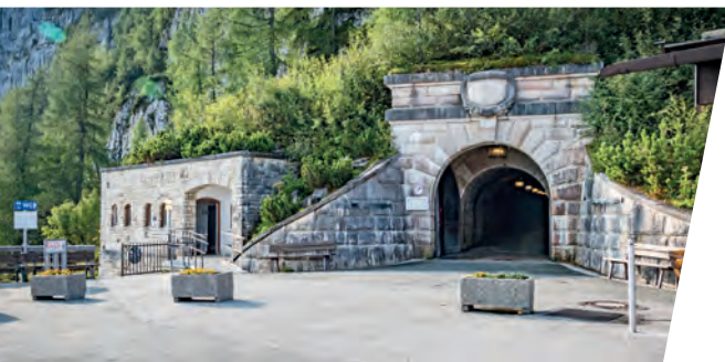
Ein beleuchteter Tunnel führt zum Aufzug im Berg. An illuminated tunnel leads to an elevator inside the mountain.

Tatsächlich blieb die Bedeutung des Hauses in der NS-Zeit gering. Hitler fuhr selten hinauf, um Diplomaten oder andere ausländische Gäste zu empfangen. Viel häufiger nutzte es die am Obersalzberg versammelte NS-Entourage zur Erholung und für private Feiern.