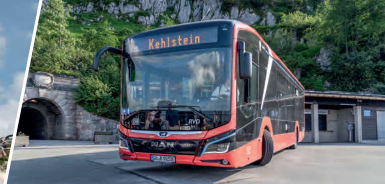
E-Bus auf der Buswendeplattform direkt unterhalb des Kehlsteinhauses Electric bus parked at the turn-around point directly below Eagle's nest.

» EIN PANORAMABLICK ZUM NIEDERKNIEN - DER AUSFLUG ZUM KEHLSTEINHAUS BEEINDRUCKT DIE GANZE FAMILIE.